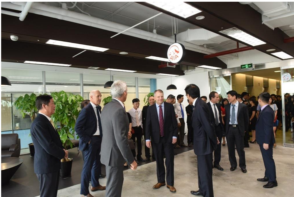
Lãnh đạo Tập đoàn AIA thăm quan văn phòng AIA Exchange trong ngày khai trương