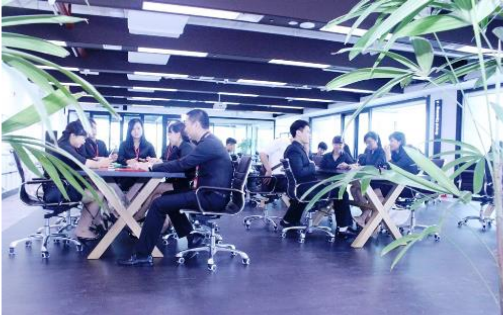
Không gian làm việc của các chuyên viên hoạch định tài chính tại AIA Exchange.

Để đáp ứng nhu cầu ngày càng cao của khách hàng, AIA Exchange tập trung tuyển dụng đội ngũ nhân sự trẻ và năng động trên thị trường để phát triển thành những chuyên viên hoạch định tài chính chuyên nghiệp. Các nhân viên sẽ được huấn luyện chuyên sâu thông qua "Học viện ngoại hạng" của AIA, đồng thời được các cấp quản lý hỗ trợ chặt chẽ và trang bị công nghệ mới để làm việc (100% chuyên viên tại AIA Exchange sẽ sử dụng iPoS trên iPad để tư vấn và hoàn tất hồ sơ yêu cầu bảo hiểm cho khách hàng). Họ sẽ là đội ngũ kinh doanh bảo hiểm nhân thọ có chuyên môn tốt, thu nhập ổn định. Ngoài ra, không gian hiện đại và năng động của AIA Exchange còn thích hợp cho các buổi gặp gỡ, chia sẻ thông tin, trao đổi về kiến thức, chuyên môn cũng như các ý tưởng sáng tạo, thu hút các bạn trẻ.