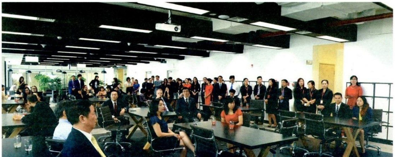
Không gian làm việc của lực lượng chuyên viên hoạch định tài chính tại AIA Exchange trong ngày khai trương