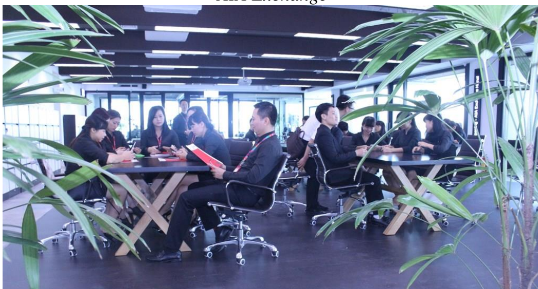
Không gian làm việc của lực lượng chuyên viên hoạch định tài chính tại AIA Exchange